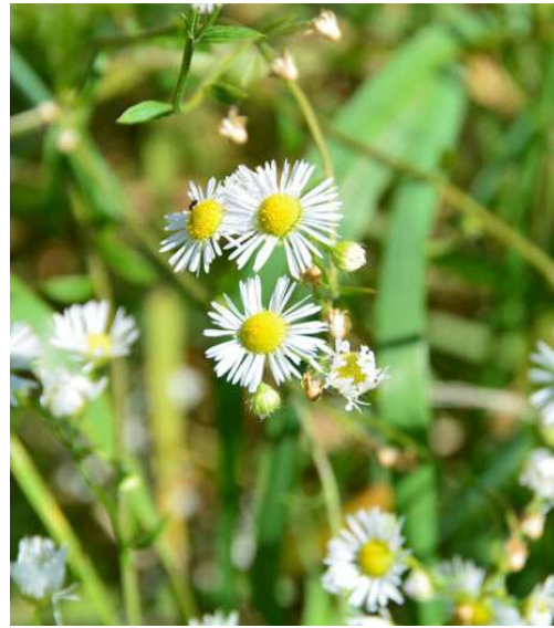
Links die kanadische Goldrute, rechts das einjährige Berufskraut.